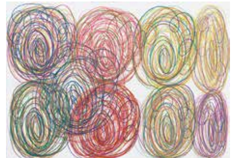
足立 茉莉 (天才アート KYOTO)