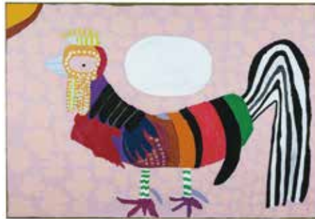
土屋 彰男 (天才アート KYOTO)