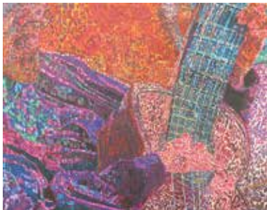
木村 全彦 (京都市ふしみ学園アトリエやっほう!!)