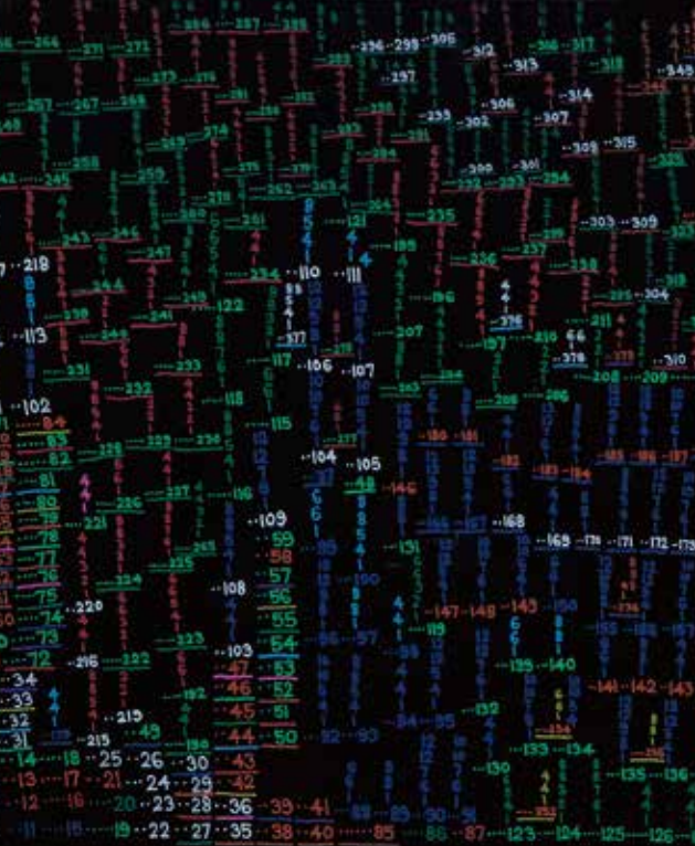
大柳 憲一 (京都市洛西ふれあいの里授産園) 作品