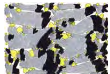
長村 駿 「魚の群れ」