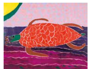
土屋 彰男 「さくらと京都水族館 春季節の海 アカウミガメ」