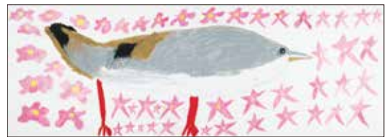
高島 晃平 「ウグイス」