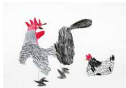
にわとり2羽 若冲模写/長村 駿