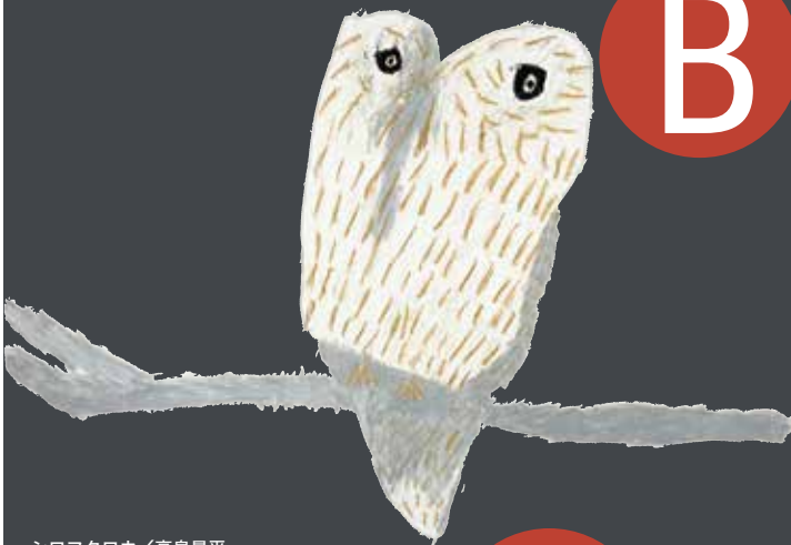
シロフクロウ/高島晃平