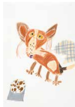
ぼくの犬 ごくう君/岸本直也